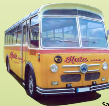
Saurer 3 DUX

Alle Oldtimer werden zu den gleichen Konditionen angeboten: